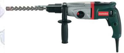
UHE 28 Plus