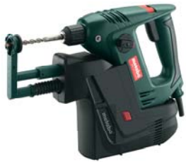
BHE 20 IDR