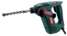
BHE 20 Compact