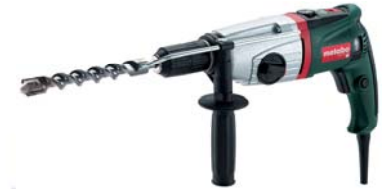
UHE 20 SP