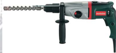
KHE 28 Plus