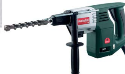
KHE 32 Code