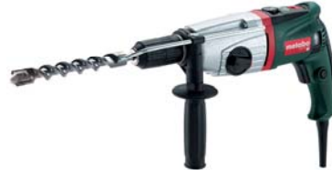
KHE 24 SP